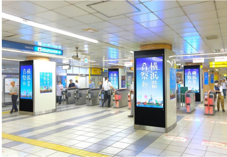
【側面ポスターセット 掲出イメージ】

横浜市営地下鉄で初のデジタルサイネージ媒体誕生！！ 改札へ向かう利用客の導線垂直に広告面が見えるため、非常に視認性の高い媒体です。デジタルサイネージ放映と、側面へのB1ポスター・全面シート貼掲出により、強力な情報発信ができます。