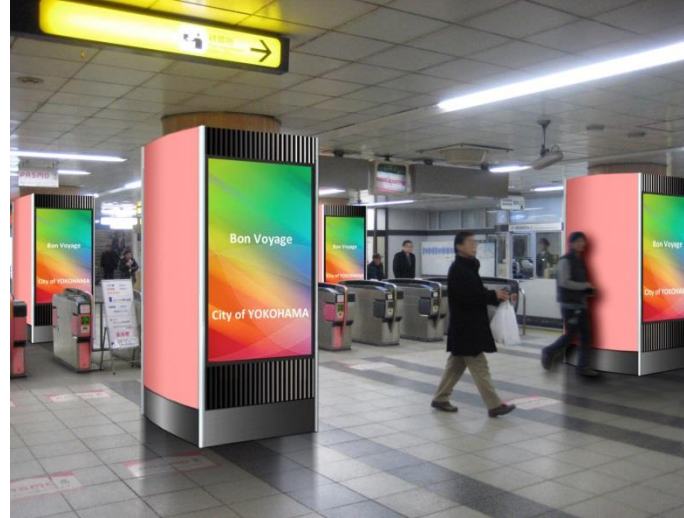
【側面全面シートセット 掲出イメージ】