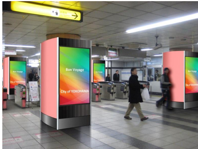
【側面全面シートセット 掲出イメージ】