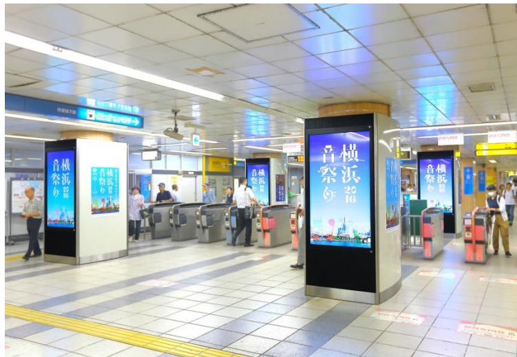
【側面ポスターセット 掲出イメージ】

横浜市営地下鉄で初のデジタルサイネージ媒体誕生！！ 改札へ向かう利用客の導線垂直に広告面が見えるため、非常に視認性の高い媒体です。デジタルサイネージ放映と、側面へのB1ポスター・全面シート貼掲出により、強力な情報発信ができます。